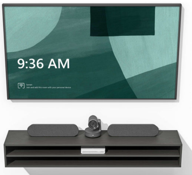
Logitech RoomMate afgebeeld met Rally Plus-systeem